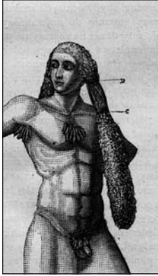
Représentation de la plica polonica dans l'ouvrage de H. Dobrzycki publié en 1877 à Varsovie

patient. 3,8,9 En outre, on pensait à l'époque que la plique détruisait le patient, provoquant ulcérations, apoplexie, convulsions, maux de tête, insomnie, cécité, surdité et une quantité innombrable d'autres maux et maladies. 4,10 C'est pourquoi ce mal était supposé circuler dans le sang et donc exister dans tout le corps. 4 Plus tard, dans la seconde moitié du XIX e siècle et au début du XX e , les professionnels de la santé ont commencé à mettre en doute l'existence de la maladie en concluant que la plique n'en était pas une, et qu'il n'y avait pas de complications après la coupe de la tresse.