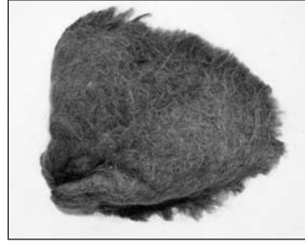
Spécimen de plica polonica conservé au Musée de l'histoire de la médecine et de la pharmacie de Lituanie à Kaunas

posant et les causes qui ont eu une influence majeure sur le développement de plica polonica . 7 Par exemple, les individus de certains groupes d'âge (maturité, grand âge) étaient considérés comme des sujets favorables à la plique. En outre, les patients de certaines classes sociales (villageois, mendiants) et les Juifs étaient considérés comme ayant un plus grand risque à développer cette maladie. Des conditions environnementales malsaines (terres marécageuses ou inondées, contact avec les vapeurs de soufre et les métaux) pouvaient provoquer la plique. La tristesse, l'anxiété, le ressentiment et l'horreur étaient également supposés prédisposer les patients à la plica polonica . Knothe se demanda également si la maladie était contagieuse ou congénitale et contesta l'association de la plique avec la syphilis, la lèpre, l'arthrite et les maladies du système lymphatique. 7