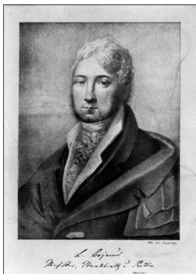
Le portrait par Maciej Przybylski (1835)

Ainsi, quand au début des années 1970 les responsables académiques lituaniens commencèrent à préparer la commémoration du 400 e anniversaire de sa création, ils voulurent marquer ce passé prestigieux et ouvert sur le monde de leur université, alors même que leur